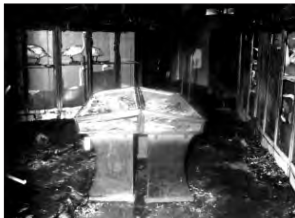
SCHADE AAN COLLECTIE EN VITRINES WAS ENORM.