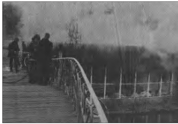
BRAND IN HET DIORAMAGEBOUW IN DIERGAARDE BLIJDORP WAAR OOK HET NATUURHISTORISCH MUSEUM WAS GEVESTIGD.

Terwijl de voorbereidingen voor de verhuizing in volle gang waren, voltrok zich op 5 mei 1987 een grote ramp. Nadat die dag de eerste verhuisactie naar Villa Dijkzigt had plaats gevonden, ontstond om 19.00 uur brand in het leslokaal van de Diergaarde. Het vuur sloeg weldra over naar de aangrenzende museumruim-