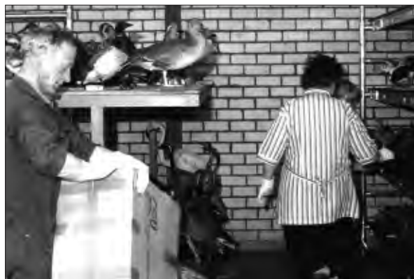
OPSLAG EN RECONDITIONERING VAN DE DOOR BRAND GEHAVENDE COLLECTIE BIJ DE FIRMA CSU TE EINDHOVEN.

week lang niet in gebruik was geweest. Er volgden vele besprekingen met de maatschappij waar de museum-inventaris was verzekerd. Aan de collectiebeheerders werd gevraagd de schade aan elke deelcollectie te inventariseren. In verband met een offerte van CSU werd een werkbeschrijving opgesteld waarin werd aangegeven wat er precies moest gebeuren. Voorts werd een persbericht verspreid met de mededeling dat ondanks de brand het museum gewoon doorging in Villa Dijkzigt. In de collectieraadvergadering van 31 mei werden de gevolgen van de brand besproken. Toen de balans werd opgemaakt, bleek dat driekwart van de collectie behouden was gebleven. De grootste klap was de vrijwel totale vernietiging van de collectie opgezette zoogdieren, en ook veel vogels die 'vooraan in de systematiek staan' en de grote exemplaren die op de kasten stonden, gingen verloren. De bibliotheek had veel (onherstelbare) waterschade, en de schelpencollectie was compleet met roet bedekt. In de weken na de brand reisden collectiebeheerders en bestuursleden regelmatig naar CSU te Eindhoven om de vorderingen van het schoonmaken na te gaan en te adviseren bij de behandeling. Met name het reinigen van de duizenden en duizenden monsters schelpen bleek een welhaast ondoenlijke klus te zijn. Ook bleken vele monsters en vindplaats-etiketten door het tamelijk overhaaste in-, uit- en overpakken door elkaar geraakt te zijn. Dat gold ook voor de collectie vogeleieren.