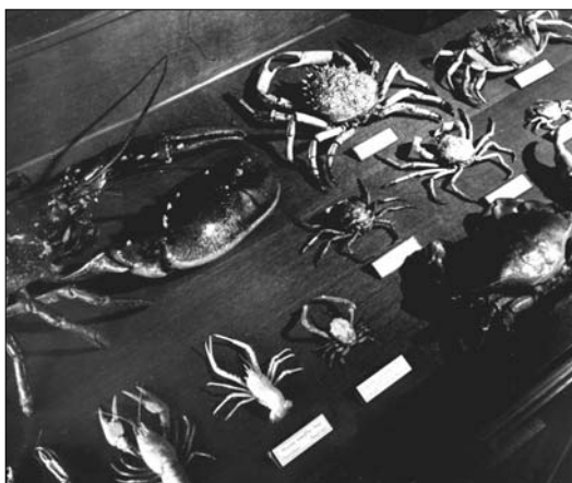
Vitrine met schaaldieren

er nog twee stuks hier te lande verzameld, nl. te Wageningen en Gulpen. Het Wageningse exemplaar is verloren gegaan, terwijl het derde in een museum in Bonn is terecht gekomen. Een andere grote zeldzaamheid vinden we tussen de rietzangers, t.w. de grote krekkelzanger, het tweede inlandse exemplaar. Een soort die waarschijnlijk vaker voorkomt, doch verward wordt met de iets kleinere snor. Van de inheemse soorten noem ik een mannetje en wijfje van de witkopgors in 1911 te Harderwijk gevangen. Buiten deze twee voorwerpen is er verder slechts één inlands exemplaar en wel in het Rijksmuseum te Leiden. Voorts nog een exemplaar van de cirlegors, een soort, die slechts zelden hier wordt aangetroffen. Niet onvermeld wil ik laten een mannelijke haakbek, welke in prachtkleed in Rotterdam werd gevangen en enkele jaren in gevangen-