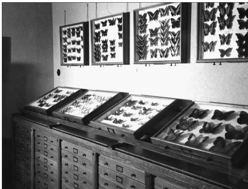
Kasten en laden met tropische vlinders

Het zou te ver voeren alle verzamelingen te bespreken. Daarom wil ik liever de collectie Nederlandse vogels wat uitvoeriger behandelen. De gehele parterruimte van ons gebouw wordt ingenomen door de vogels. Hoewel nog slechts een 225 soorten vertegenwoordigd zijn, bevinden zich hieronder toch verschillende zeer zeldzame stukken. Zo zien we dadelijk bij het binnenkomen de kast met duikers en stormvogels. Onder deze laatste groep bevindt zich een exemplaar van de zeer zeldzame grauwe pijlstormvogel, verzameld te Wijk aan Zee. Slechts twee of drie exemplaren zijn uit Nederland bekend. De grauwe pijlstormvogel is broedvogel van het zuidelijke halfmond, die slechts sporadisch op het noordelijk halfmond langs de kusten van de landen aan de Atlantische Oceaan en de Noordzee verschijnt. Onder de eenden treffen we het eerste voorwerp voor Nederland aan van de witkopeend, een wijfje, hetwelk in 1851 op de Nieuwekerkse plassen nabij Rotterdam werd geschoten. Vòòr de drooglegging (thans Prins Alexanderpolder) bevond zich hier het beroemde Schollevaars-eiland, broedplaats o.a. van de zeldzaam geworden kwak. Een andere zeldzame soort treffen we onder de roofvogels aan, nl. de schreeuwend, een soort, die in weinig exemplaren in Nederland is aangetroffen. Verreweg de zeldzaamste vogels uit onze collectie is de dwergooruil, een unicum voor Nederland. Het eerste en tot nu toe enigste in ons land bewaard gebleven voorwerp. In 1890 werd deze vogel te Rotterdam gevangen aan de Maas. Nadien zijn