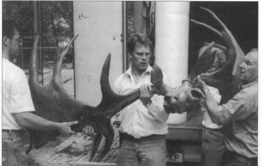
het 'Zwolsche reuzenhert' wordt met vereende krachten het museum binnengedragen

Ik wil hier niet uitweiden over de inhoudelijke kant van de tentoonstelling; daarvoor is het aan te bevelen om gewoon 'topstukken tentoon' te komen bekijken en de catalogus te kopen (voor maar f 7,50 nauwelijks te missen).