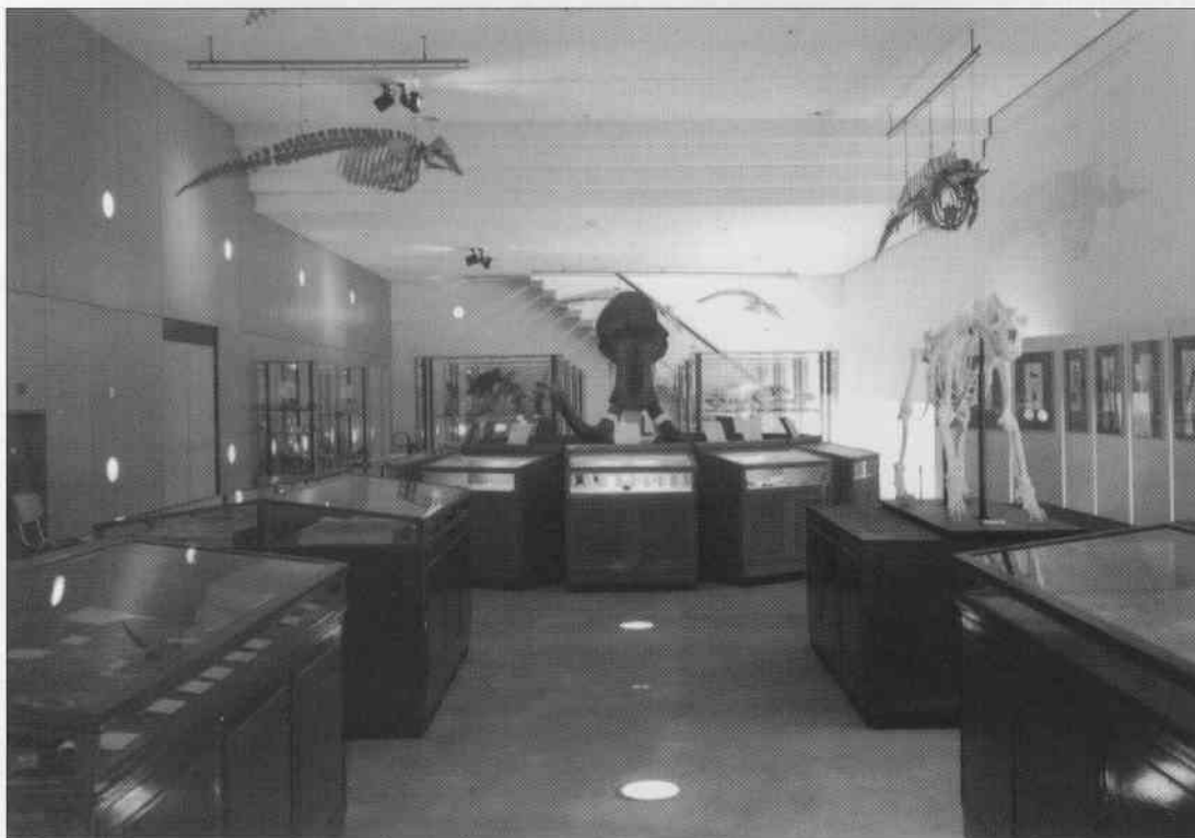
Overzicht van de tentoonstelling Dierbaar Bezit