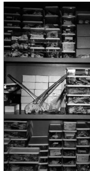
Een deel van de nieuw verworven collectie vogel-schedels en -skeletonten.

Veel recent-historisch materiaal, onder andere afkomstig van het eiland 'de Beer', bevond zich in de herbaria die Henk de Jong (96-006) en Rochus Biesheuvel (96-050) aan de collectie toevoegden. Van mindere kwaliteit, maar toch ook aanwinsten die vermelding verdienen, waren de 40 gedroogde planten die mevrouw Ypenburg-Visser schonk (96-031). Herbariumbeheerder Remko Andeweg schreef in totaal 332 planten in het aanwinstenboek. Hieronder veel Rotterdamse stadsflora, waaronder – om maar een paar willekeurige voorbeelden te noemen – : ijzerhard Verbena officinalis (IJsselmonde, 96-334),