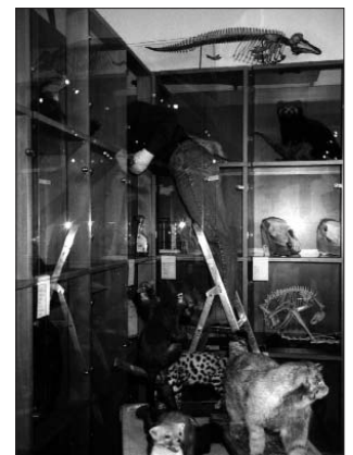
De preparaten voorzichtig afstoffen en vervolgens de kasten schoonmaken: een fikse klus met al het glas.