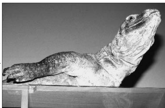
Komodovaraan op de kast in WERELDNATUUR