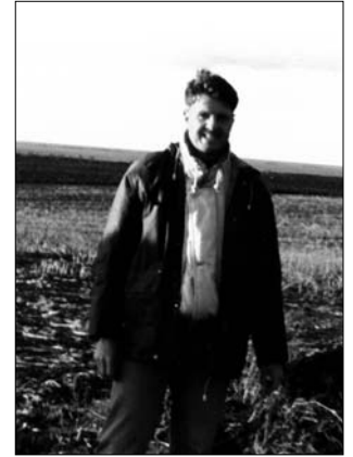
Boven: De auteur in een omgeploegde akker op Rügen.