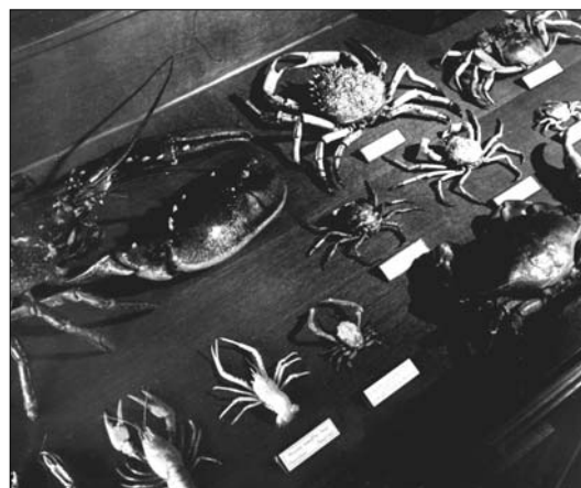
Vitrine met schaaldieren

er nog twee stuks hier te lande verzameld, nl. te Wageningen en Gulpen. Het Wageningse exemplaar is verloren gegaan, terwijl het derde in een museum in Bonn is terecht gekomen. Een andere grote zeldzaamheid vinden we tussen de rietzangers, t.w. de grote krekkelzanger, het tweede inlandse exemplaar. Een soort die waarschijnlijk vaker voorkomt, doch verward wordt met de iets kleinere snor. Van de inheemse soorten noem ik een mannetje en wijfje van de witkopgors in 1911 te Harderwijk gevangen. Buiten deze twee voorwerpen is er verder slechts één inlands exemplaar en wel in het Rijksmuseum te Leiden. Voorts nog een exemplaar van de cirlgors, een soort, die slechts zelden hier wordt aangetroffen. Niet onvermeld wil ik laten een mannelijke haakbek, welke in prachtkleed in Rotterdam werd gevangen en enkele jaren in gevangen-