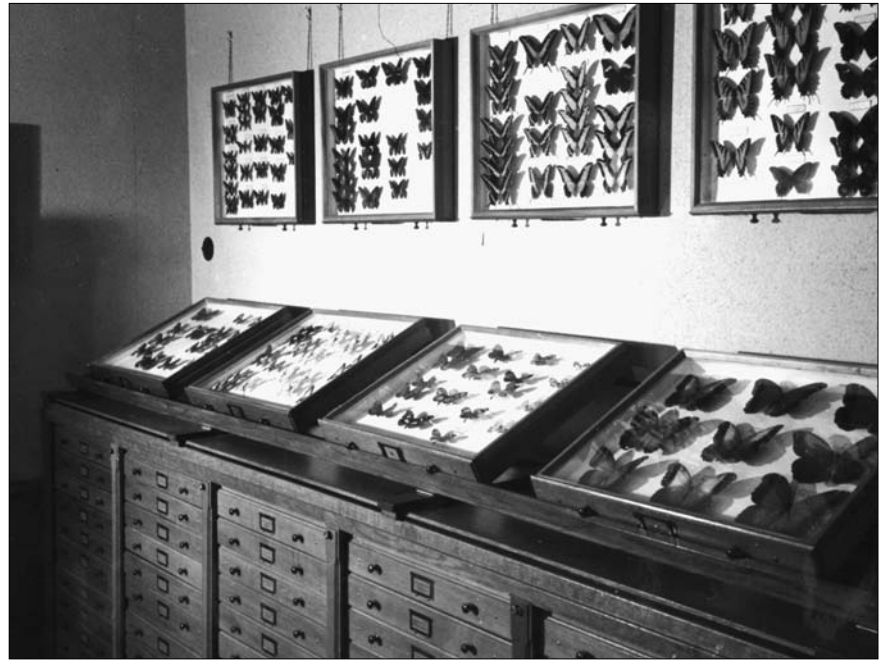
Kasten en laden met tropische vlinders

Het zou te ver voeren alle verzamelingen te bespreken. Daarom wil ik liever de collectie Nederlandse vogels wat uitvoeriger behandelen. De gehele parterruimte van ons gebouw wordt ingenomen door de vogels. Hoewel nog slechts een 225 soorten vertegenwoordigd zijn, bevinden zich hieronder toch verschillende zeer zeldzame stukken. Zo zien we dadelijk bij het binnenkomen de kast met duikers en stormvogels. Onder deze laatste groep bevindt zich een exemplaar van de zeer zeldzame grauwe pijlstormvogel, verzameld te Wijk aan Zee. Slechts twee of drie exemplaren zijn uit Nederland bekend. De grauwe pijlstormvogel is broedvogel van het zuidelijke halfmond, die slechts sporadisch op het noordelijk halfmond langs de kusten van de landen aan de Atlantische Oceaan en de Noordzee verschijnt. Onder de eenden treffen we het eerste voorwerp voor Nederland aan van de witkopeend, een wijfje, hetwelk in 1851 op de Nieuwekerkse plassen nabij Rotterdam werd geschoten. Vòòr de drooglegging (thans Prins Alexanderpolder) bevond zich hier het beroemde Schollevaars-eiland, broedplaats o.a. van de zeldzaam geworden kwak. Een andere zeldzame soort treffen we onder de roofvogels aan, nl. de schreeuwend, een soort, die in weinig exemplaren in Nederland is aangetroffen. Verreweg de zeldzaamste vogels uit onze collectie is de dwergooruil, een unicum voor Nederland. Het eerste en tot nu toe enigste in ons land bewaard gebleven voorwerp. In 1890 werd deze vogel te Rotterdam gevangen aan de Maas. Nadien zijn