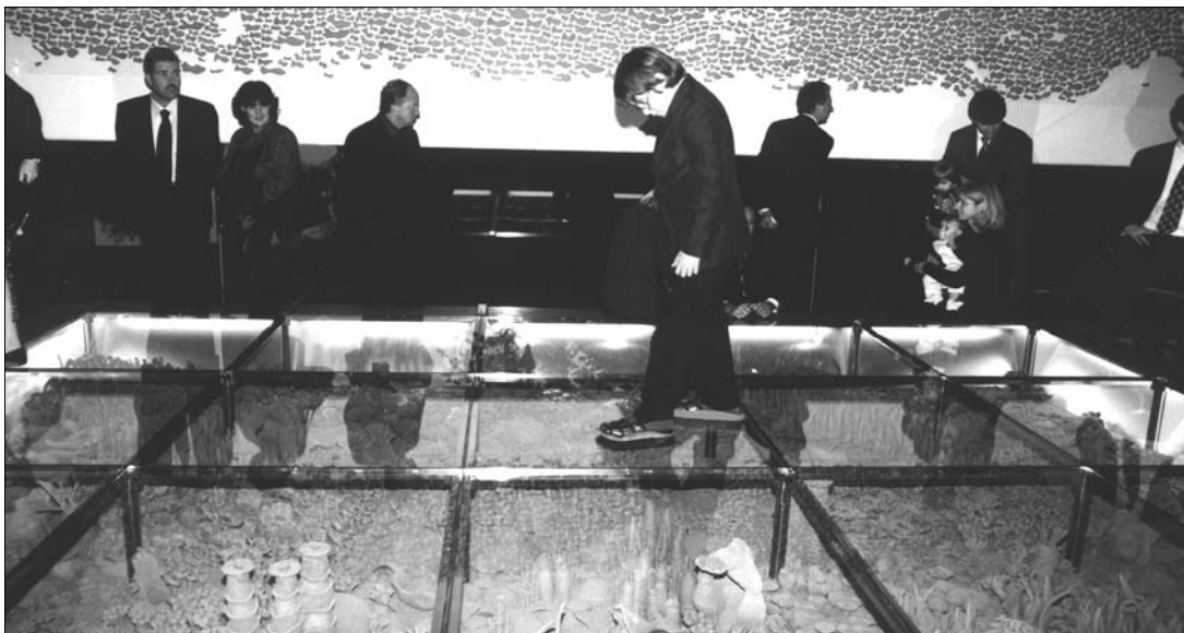
Schoorvoetend betreedt men de terracotta zeebodem.