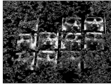
Aqua Obscura X

De voorbereidingen voor het tentoonstellingsprogramma voor het jaar 2001 (wanneer Rotterdam culturele hoofdstad van Europa) zijn al in volle gang. Het 2001-programma gaat van start op 6 januari met de reprise van KRUIP UIT JE HUID, waarna op 26 mei de klapper 'DE WERELD VAN BOUDEWIJN BÜCH' begint. Op 21 september opent, terwijl 'Boudewijn Büch' nog voortduurt, een expositie over 100 jaar sociale tandheelkunde in Rotterdam ter gelegenheid van het 100-jarig bestaan van de Rotterdamse Tandartsen Vereniging.