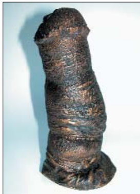
Nieuw in de museumwinkel: paardenpenis

De museumwinkel heeft in het kader van PLANT JE VOORT! een aantal zeer natuurgetrouwe afgietsels van een paardenpenis laten maken; te gebruiken als pressepapier of gewoon ter decoratie in de vensterbank. De in bronskleur uitgevoerde penissen kosten E 25,- per stuk en de voorraad is zeer beperkt.