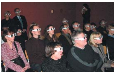
3D insecten peepshow

vanaf 23 maart 2003 TUSSEN TOERIST EN TALAIOT een reis door de prehistorie van de Balearen