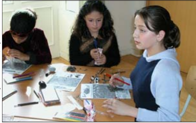
Braakballen pluisen

Op maandag 4 november ging bij ons in het museum de Nationale Braakbal Pluisweek van start: honderden leerlingen in acht natuur-musea plozen duizenden uilenballen uit. De Nationale Braakbal Pluisweek is een jubileumactiviteit van de 50 jarige Vereniging voor Zoogdierkunde en Zoogdierbescherming (VZZ) die samen met de Vrije Vogel Club en het Natuurmuseum Rotterdam werd georganiseerd. Reacties van publiek, pers en betrokkenen waren zo positief dat gedacht wordt om er een (twee)jaarlijks terugkerend evenement van te maken. Daarvoor zijn weer braakballen nodig, want er zijn nationaal ruim 2000 ballen tot stof en bot gereduceerd. Mocht u - waar dan ook - tegen een partijtje braakballen aanlopen (let op poepstrepen op boomstammen): wij nemen ze graag in ontvangst.