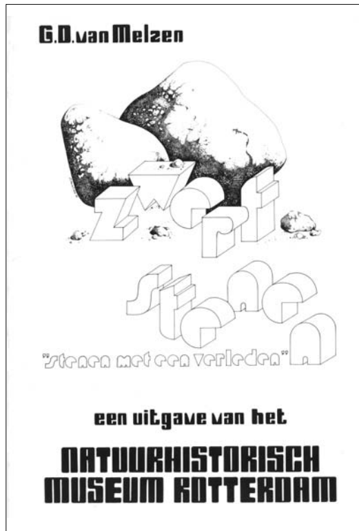
OMSLAG VAN HET BOEKJE VAN G.D. VAN MELZEN GETITELD 'ZWERFSTENEN, STENEN MET EEN VERLEDEN' (1982), GIDS BIJ DE GELIJKNAMIGE TENTOONSTELLING.