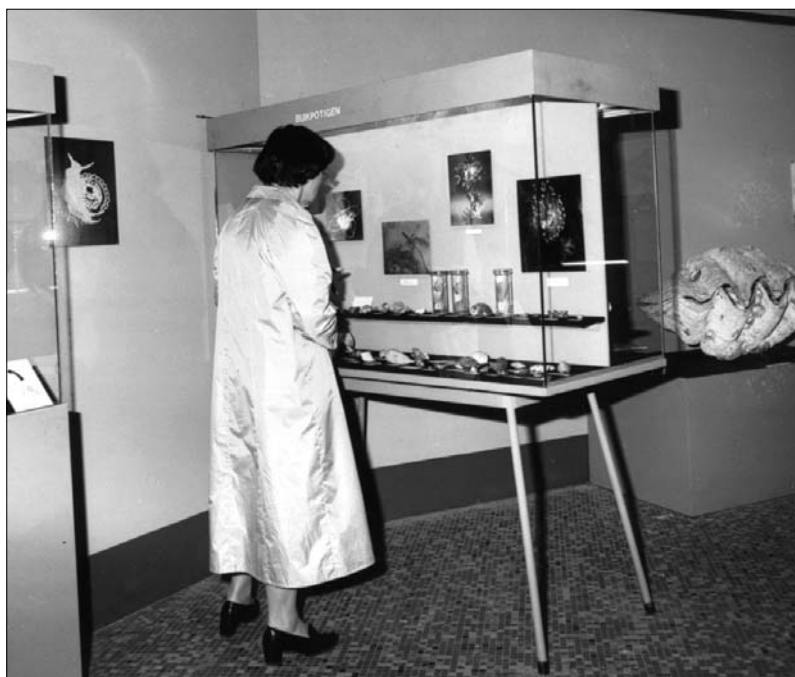
DE TENTOONSTELLING 'WEEKDIEREN...EEN KLASSE APART', 1981.