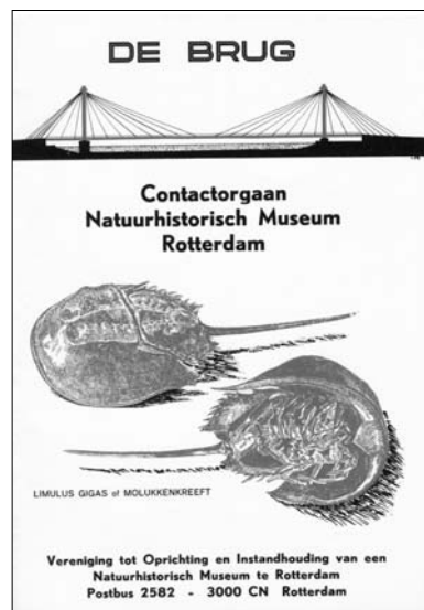
'DE BRUG', OPVOLGER VAN 'INFORMATIE BULLETIN' (1981).

Tijdens de bovengenoemde ledenvergadering werden er nog enkele belangrijke stukken genoemd. Zo werd door de Stichting Bevordering van Volkskracht een bedrag toegezegd van f 8000,- voor het