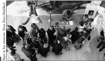
Rijen in het museum.

Al vroeg in de ochtend van de eerste dag (na de opening), toen de platgetrapte borrelnoten nog van het parket gekrabbt moesten worden, dromden de eerste bezoekers die zeker wilden zijn van een plaatsje in een rondleiding, kleumend samen op het bordes van het museum. Toen de museumdeuren om tien uur open gingen, had zich een heuse rij gevormd en waren na een half uur alle rondleidingen vol. Flexibiliteit bij medisch-studenten (de rondlei-