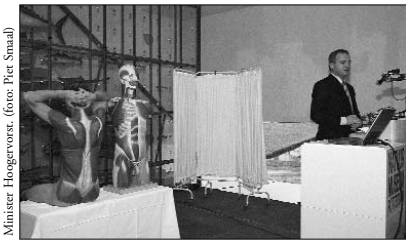
Minister Hogervorst.

Leeuw'. Professor Osterhaus kreeg deze (hele) hoge onderscheiding 'omdat het Hare Majesteit behaagt heeft' op grond van zijn internationaal toonaangevende positie binnen de virologie, en zijn uitzonderlijke maatschappelijke prestaties op dat gebied. Niet geheel onverwacht ging de lezing waarmee hij de aanwezigen in de Parkzaal ruim een half uur wist te boeien over de blijvende dreiging van virusinfecties. De aansluitende receptie - perfect verzorgd door onze huiscateraar Maïtre Frédérique - hield veel van de dorstigen gelukkig tijdelijk op de begane grond, want boven, op de eerste verdieping van het museum, kraakten de vloeren onder de voeten van de vele belangstellenden bij de Mensbeeld-vitrines en de endoscopie demonstraties.