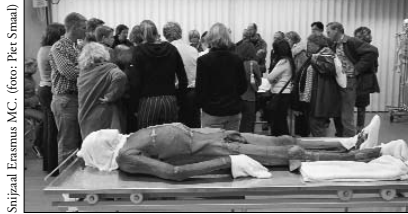
Snijzaal Erasmus MC.

Het museum deed traditiegetrouw jaarlijks mee aan de wetenschapsdag, de laatste dag van de Wetenschapsweek, die tegenwoordig Wetenweek heet. Wetenschapsdag in het Natuurmuseum betekende depotrondleidingen en collectiebeheerders die preparerden en determineerden. Dit jaar werd deze traditie overboord gezet en kon dankzij en in samenwerking met het Erasmus MC een aan Mensbeeld gekoppeld programma samengesteld worden dat de hele Wetenweek, van 15 t/m 22 oktober, duurde. Het