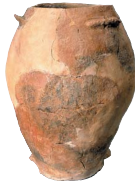
Neolithische pot van Son Margó.