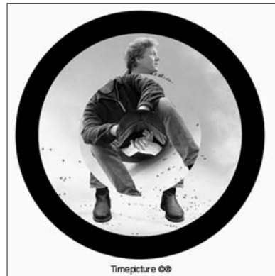
'Timepicture' van Sebastian Vos.

Eind juni starten onder deze overkoepelende titel twee exposities met werk van de Groningse kunstenaars Jacques Hammes en Sebastiaan Vos. Hammes presenteert een fraaie serie plasticen in Brons en Vos - die zichzelf 'beeldend uitvinder' noemt - hangt een paar honderd klokken op met afbeeldingen van (stad)groningers, keurig verdeeld in drie draaiende parten. De grootste cirkel draait per uur en laat het hoofd zien, de middelste draait per minuut en toont de romp, en de kleinste draait rond met de afbeelding van de onderste ledematen. Eens in het uur vormen de drie schijven de volledige gestalte. Het bekijken van de klokken, en het wachten op de eenwording van de afgebeelde persoon leidt, volgens Vos tot "een stukje onthaasting". PLASTIEKEN IN BRONS en VERLOOP VAN TIJD zijn te zien van 29 juni t/m 28 september 2003.