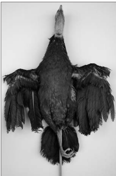
De balg van Bruijns boshoen, NMR 9989-0 (606).