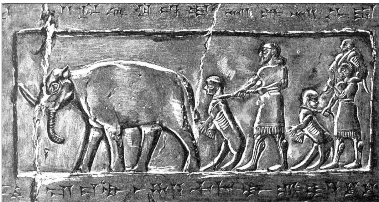
KLEITABLET MET SPIJKERSCHRIFT AFKOMSTIG UIT HET GEBIED DAT NU IRAK HEET. [UIT: G. MASPERO, 1904, HISTORY OF EGYPT, VOL. VIII]

Nu is dus het Iraakse cultuurbezit verdwenen. De eerste bewijzen van de menselijke beschaving, de oorsprong van het ontstaan van een gestructureerde en stedelijke leefwijze, het oudste overgeleverde (spijker)schrift, dat alles is teloor gegaan in een orgie van vernietiging. De vertegenwoordigers van de beschaving stonden erbij en keken toe. Ze waren te druk met het zoeken naar massavernietiging, maar stonden er naast. []