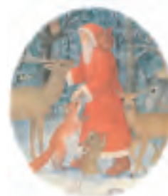
Illustratie: Eleonore Schmid