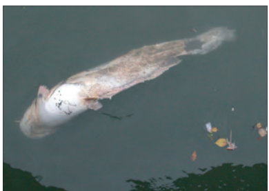
Meerval in Leuvehaven. (Kees Moeliker)

Op vrijdagmiddag 30 september 2005 kreeg het museum een melding van Het Havenmuseum dat er in de Leuvehaven te Rotterdam een grote dode vis ronddreef. "Het lijkt wel een meerval en hij heeft een dikke buik" werd er gezegd. Het was inderdaad een meerval ( Silurus glanis ). Hij dreef met zijn (van de rottingsgassen bolstaande) buik omhoog tussen twee rijen kaden in de richting van de kade bij het Maritiem Museum. Met een door het Havenmuseum beschikbaar gestelde pikhaak kon het kadaver op het droge getild worden. De vis, van ongeveer anderhalve meter lengte, stonk zoals een dode vis behoort te ruiken: als een oordeel. Uit voorzorg werd de op springen staande buik aangeprikt zodat het meeste stin-