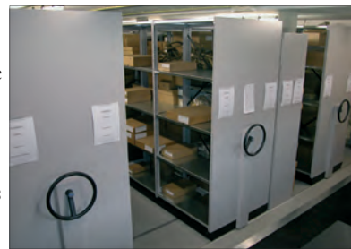
Nieuwe rolstellingen.