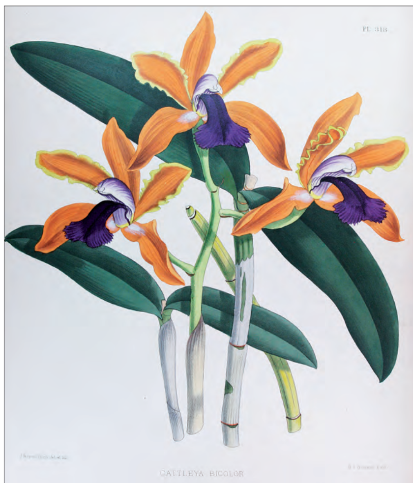
▲ Cattleya bicolor (Brazilië), plaat 318 uit The Orchid Album.

Bewust is gekozen voor het prettige 'royal quarto' formaat. De boeken zijn hierdoor op schoot gehouden in de luie stoel gemakkelijk door te bladeren. Ook kon de tekenaar met dit gekozen formaat de planten op ware grootte afbeelden: 'Being of Royal Quarto size, the pages of the Album are sufficiently large to enable the artist to produce ample and intelligible portraits of the plants without their become cumbersome.'