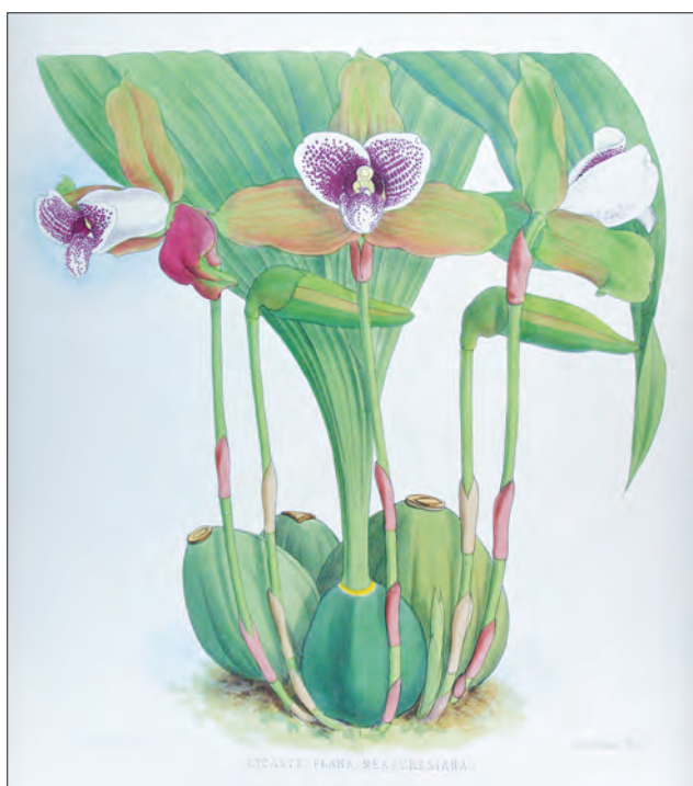
▲ Lycaste plana measuresiana (Bolivia), plaat 306 uit The Orchid Album.

Het zal duidelijk zijn dat wij met de schenking van de acht delen van The Orchid Album een prachtige aanwinst in huis hebben die gekoesterd zal worden. In Nederland bezitten zowel de Universiteit van Amsterdam als die van Leiden (Nationaal Herbarium) een complete set. Mocht u toevallig de delen 9, 10 en 11 in de boekenkast hebben staan, dan completeren we daar graag de Rotterdamse set mee. ◀