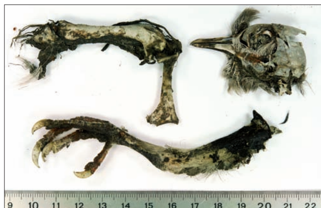
▲ Prooiresten van de slechtvalk, gevonden op de Willemsbrug: kop van een Turkse tortel [rechts], poot [onder] en opperarmbeen [links] van een stadsduif. (Kees Moeliker)