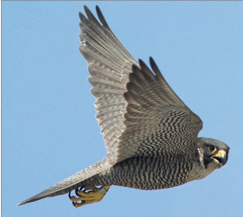
▲ Slechtvalk (vrouwje) op 125 meter hoogte; Maasvlakte, 13 juni 2006.