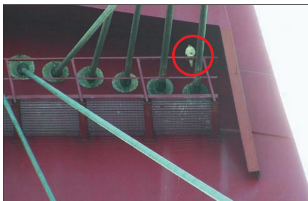
▲ Slechtvalk op de Willemsbrug; mei 2007.