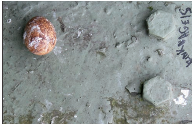
▲ Vorm, maat en kleur wezen op een ei van een slechtvalk. (Garry Bakker)

vermoedelijke nestplaats zou zijn. In overleg met de eigenaar van de brug, het Havenbedrijf Rotterdam, controleerde bSR-ecoloog Garry Bakker de beoogde nestplaats. Tot zijn vreugde trof hij een ei aan dat echter onbeheerd en onbeschut op een kale stalen plaat lag. Het formaat (van een gemiddeld kippenei), de vorm en de roodbruine kleur met donkere tekening, wezen zeker op het ei van een slechtvalk. Er werden tijdens dit bezoek geen volwassen slechtvalken waargenomen. Aangezien de slechtvalk normaal gesproken drie tot vier eieren legt (Cramp & Simmons 1980), bestonden weinig illusies over de slagingskansen van dit legsel. Op 8 mei en 8 juni 2009 werd het vrouwtje nog op en rond de broedplaats waargenomen. Vanaf de grond was echter geen enkele suggestie van de aanwezigheid van een jonge valk te bespeuren. Op 9 juli 2009 is de brug wederom bezocht. Hoewel er nog prooiresten en ontlasting te vinden waren, bleek duidelijk dat er geen jongen op de brug zijn grootgebracht.