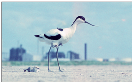
▲ Kluut met jongen, met op de achtergrond de naderende industrie van de Botlek, juni 1960. (Karel Schot)