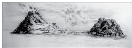
▲ Het Eiland, 430 x 155 cm. (Marion Duursema)

Deze combinatie van materialen en de werkwijze laat onvoorspelbare factoren toe die symbool staan voor de grilligheid en onvoorspelbaarheid van natuurkrachten. De voorstelling die dan ontstaat wordt letterlijk genomen