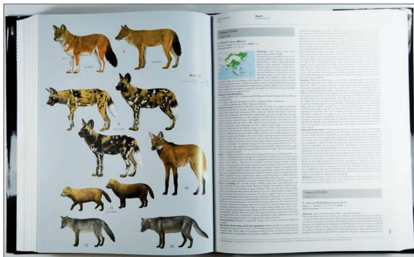
▲ Kleurenplaten met bijbehorende soortbeschrijvingen.