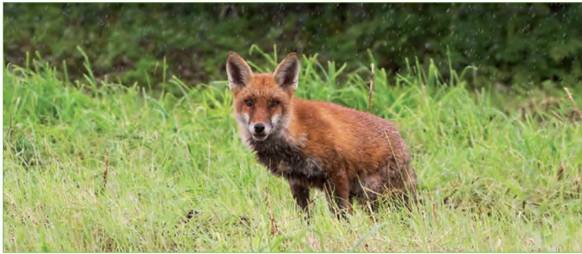
▲ Vos in de regen op De Esch in Rotterdam; 29 augustus 2010.

open. Bewoners van Terbregge begonnen sinds 2006 vossen te melden, net als wandelaars en hondenbezitters in Park Zestienhoven en het Kralingse Bos. Op de campus van de Erasmus Universiteit aan de Laan van Woudestein in Kralingen figureert een vos regelmatig op videobeelden van de beveiliging.