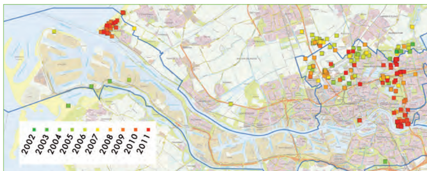
▲ Waarnemingen van de vos binnen en vlak buiten de gemeentegrens (blauwe lijn) van Rotterdam in de periode 2002-2011.

Tegenwoordig komt de vos vrijwel overal voor, met uitzondering van de Waddeneilanden, Noordwest-Friesland en delen van de Zeeuwse en Zuid-Hollandse eilanden. Deze afwezigheid heeft alles te maken met het landschap. Eilanden zijn alleen zwemmend te koloniseren en zullen dus als laatste opgevuld worden. En de uitgestrekte, veelal boomloze zeekeigraslanden in Friesland hebben een vos weinig te bieden. Dat geldt ook voor het Groene Hart van Zuid-Holland, waar dit roofdier eveneens schaars is.