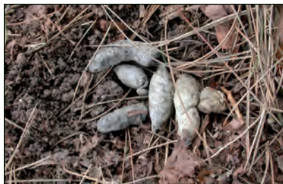
▲ De vos van de Zuiderbegraafplaats te Rotterdam werd nooit gezien, maar de keutels onder reigernesten verraadde zijn aanwezigheid; 20 maart 2006. (Sander Elzerman)

Veel mensen vragen zich af wat de komst van de vos in onze stad voor gevolgen gaat hebben. Vormt de soort een risico voor de volksgezondheid? En welke overlast brengen vossen met zich mee? In het rapport dat bSR over de vos in Rotterdam heeft geschreven wordt uitgebreid op deze kwesties ingegaan (De Zwarte et al. 2011). De belangrijkste conclusie is dat u er waarschijnlijk niet veel van gaat merken. Vossen zijn schuwe dieren die ook in stedelijk gebied contact met mensen zullen vermijden. De kans dat u direct in aanraking komt met een wilde vos is daarom, ook in delen van de stad waar veel vossen rondlopen, klein. Daardoor, en vanwege het feit dat West-Nederlandse vossen vrijwel geen gevaarlijke ziektes dragen, is de kans op ziekteoverdracht zeer klein. Huisvuil plunderen