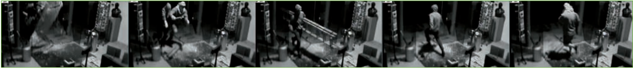
▲ Beelden van de inbraak, opgenomen met een bewakingscamera.