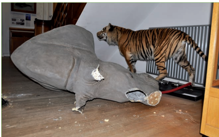
▲ De neushoornkop zoals aangetroffen na de inbraak op 26 augustus 2011.