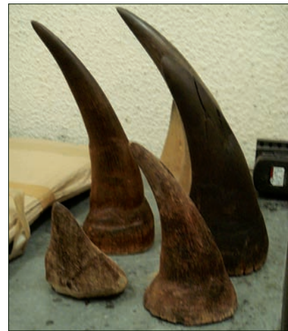
▲ Neushoornhoorns in beslag genomen in Portugal, september 2011.

De vernielde en ont hoornde kop wordt nu gerestaureerd, en - omdat we nu geen keuze meer hebben - voorzien van kunststof