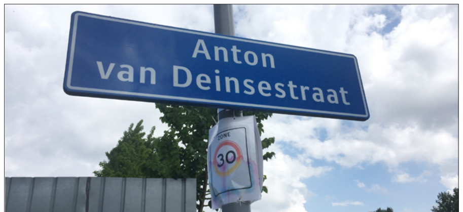
▲ Straatnaambordje in de Rotterdamse wijk De Esch, mei 2017. (Kees Moeliker)