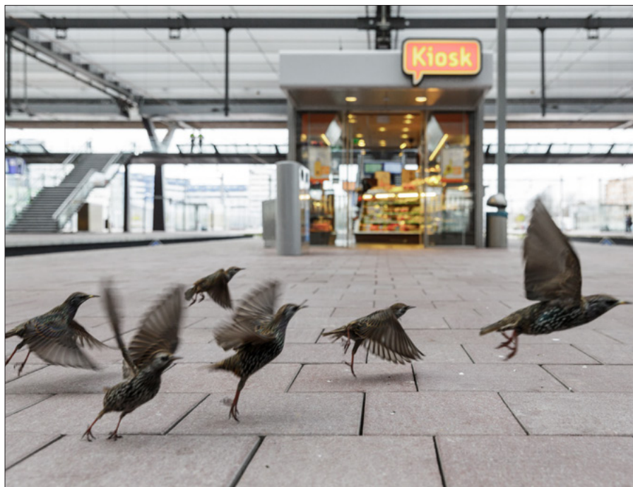
▲ Voor de Rotterdamse spreeuwen zijn de perrons rijke voedselgronden. (Jasper Doest)

iedereen blij met een station vol vogels. In 2016 startte de NS een proef met een laserkanon dat het station op diervriendelijke wijze vogelvrij moest maken. De vogels zouden reizigers lastigvallen. Bovendien maken spreeuwen poepjes. Hoewel de proef verontwaardigde reacties opriep, is het beeld van de spreeuw als schadelijke vogelsoort niet nieuw. Uit oude krantenberichten blijkt dat de bomen van de Coolsingel in de jaren tachtig dienst deden als slaappleats van een enorme hoeveelheid spreeuwen. Voor sommige Rotterdamers ligt de onder een dikke laag spreeuwenmest besmeurde straat nog vers in het geheugen. Een uitglijder in de stinkende smurrie was beslist geen pretje en gevaarlijk bovendien. Bij de aanpak van spreeuwenproblemen werd indertijd geen diervriendelijke laserstraal ingezet. Wel een harde waterstraal van een brandweerspuit waarmee men de slapende vogels zonder pardon uit de boom spoot. Ook in de landbouw werd de spreeuw als hinderlijk plaagdier bestempeld. Een profiteur die zaaigoed opat en fruitbomen plunderde. Een regelrechte parasiet.