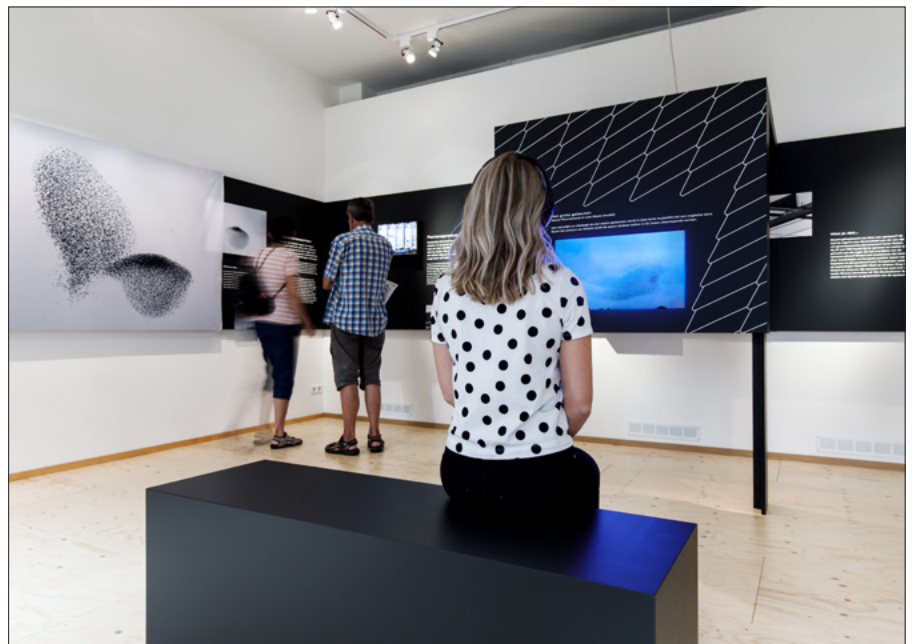
▲ Expositie 'Spreekw Centraal' belicht uiteenlopende aspecten van het spreekwleven. (Aad Hoogendoorn)

hele jaar door te horen en wordt door zowel de mannetjes als de vrouwtjes ten gehore gebracht. Daarbij mag het fenomenale imitatievermogen van de spreekw niet onvermeld blijven. Tot verbazing van velen beschreef Moeliker hoe de spreekw van perron negen het geluid van een vertrekkende sprinter perfect beheerste. Tot het gesis van de deuren aan toe. Hoeveel reizigers zich hierdoor in de luren lieten leggen werd niet vermeld, maar de hilariteit was er niet minder om. De spreekwenzang brengt een levendige sfeer in het station die er anders misschien niet was geweest. Koos Dijksterhuis schreef in zijn boek De spreekw (2016): "Op 1 november 2015 stap ik uit de trein in Rotterdam en is het langgerekte 'pieeuw' van een spreekw het eerste wat ik hoor. Vervolgens klinkt een welkomstlied van fluitende en tjlpende spreekw. [...] De zon schijnt door die prachtige nieuwe stationskap en de spreekw vlooien zichzelf, ze schudden met hun vleugels en zingen zorgeloos."