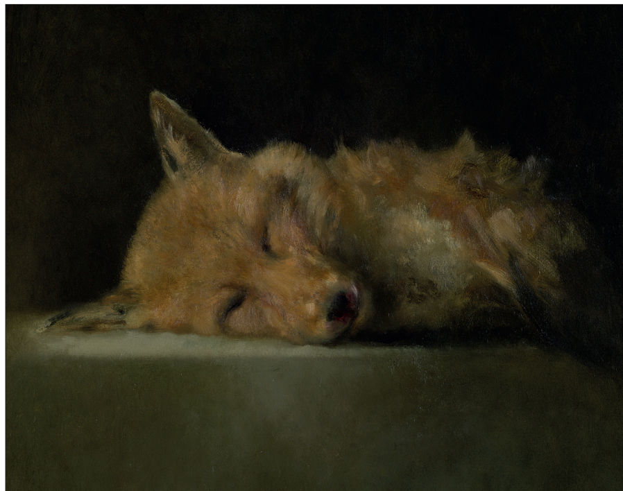
▲ Vossenkop; 49 x 53 cm. (Pieter Knorr)

Dode dieren zijn kind aan huis bij Het Natuurhistorisch. Ze krijgen na een preparatieproces, geconserveerd een permanente plaats in de museumcollectie, voor wetenschap, educatie en presentatie. Anders dan in het museum, laat Pieter Knorr in zijn atelier de dood de dood maar hij conserveert wel. Met olieverf op paneel verheft hij de beeltenis van het dode dier tot kunst die voortleeft. Zijn interventies zijn minimaal: een vleugel hangt af, pootjes kruisen, een baksteen als ondergrond. Een drijfnapte muis blijft drijfnapte. Het resultaat is een groeiende serie dode dierschilderijen waarvan een flink deel, mede dankzij welwillende bruikleengevers, nu onder de titel 'Ademloos' werd samengebracht in een tentoonstelling in onze Van Roonzaal.