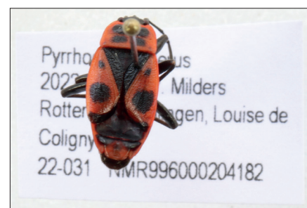
▲ Een van de nieuwe aanwinsten uit Kralingen; NMR 996000204182.

Omdat Rotterdamse exemplaren ontbraken, heb ik vier vuurwantsen bij mij in de straat verzameld: twee volwassen dieren en twee nimfen. Deze zijn inmiddels in de collectie opgenomen onder de catalogusnummers NMR 996000204182 t/m -85.