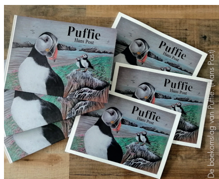
De boekomslag van Puffie - © Hans Post

Puffie is verschenen in eigen beheer in een luxe hardcover editie (ISBN 9789090358543 - 36,50 euro inclusief verzenden) en een softcover editie (ISBN 9789090360546 - 26,50 euro inclusief verzenden). Beide edities tellen 60 pagina's en zijn in fullcolour gedrukt op luxe fotopapier. Het boek is rechtstreeks verkrijgbaar bij de schrijver via ijn.post@gmail.com . Uiteraard is Hans graag bereid het boek te signeren.